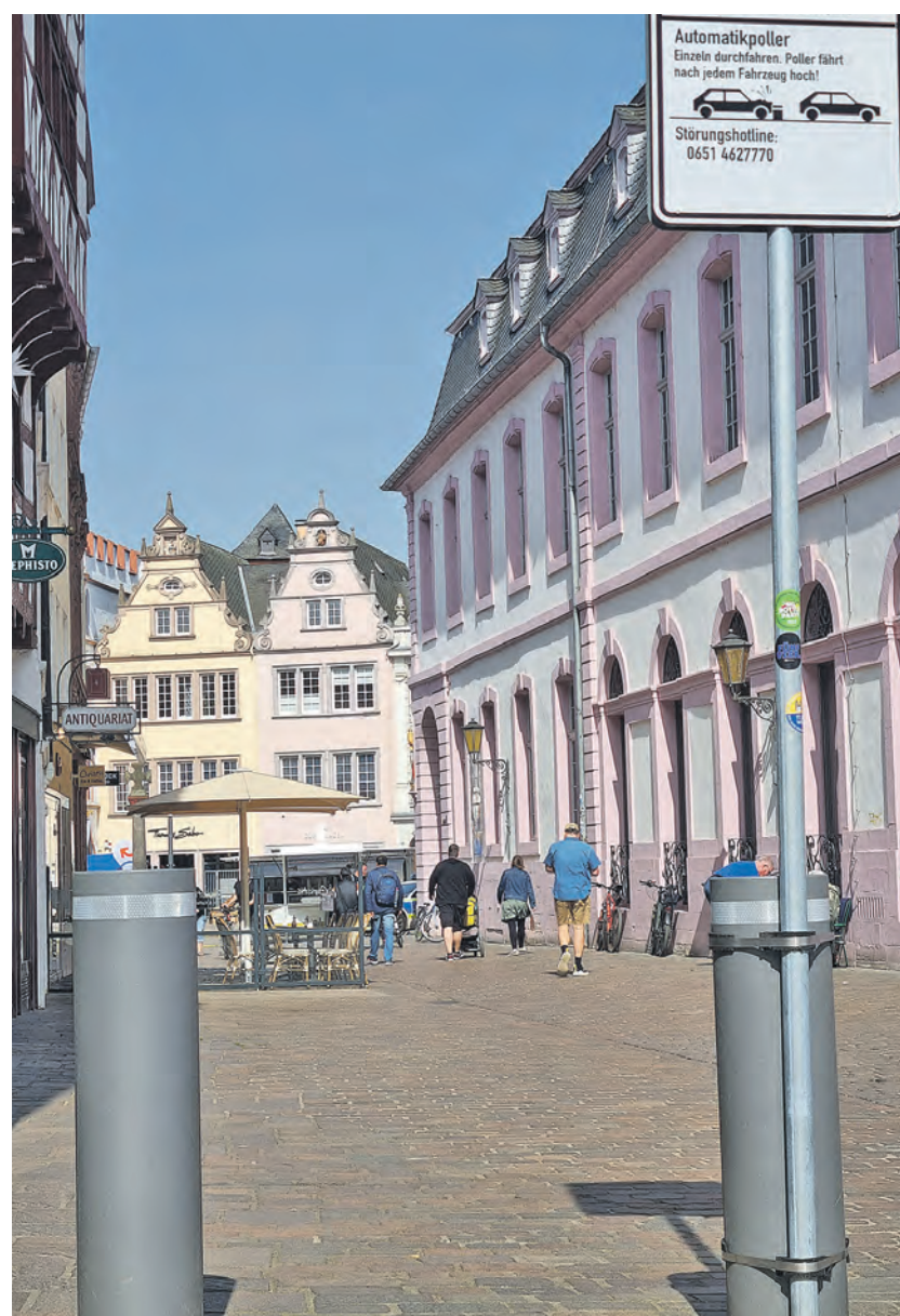
Nächste Etappe. Während am Beginn der Sternstraße (aus Richtung Domfreihof) schon Poller stehen, ist diese Umstellung in dem dahintergelegenen Hauptmarkt nach dem Altstadtfest geplant.

Nicht die Autos machen Umsätze in den Geschäften und der Gastronomie, sondern die Menschen. Die müssen sich in der Fußgängerzone wohl fühlen und gut hinkommen, damit sie viel Zeit in Triers toller Innenstadt verbringen. Autos fühlen sich in den Parkhäusern wohl – allein die SWT-Parkhäuser haben 3200 Plätze, die allesamt günstiger sind als die Parkplätze im öffentlichen Raum. Die Parkhäuser liegen teils mitten drin in der City, schneller und komfortabler kommt man eigentlich nicht zum Einkaufen. Jetzt arbeiten wir daran, dass in den nächsten Jahren auch das ÖPNV-Angebot noch besser wird. Das Deutschland-Ticket gibt es schon, die