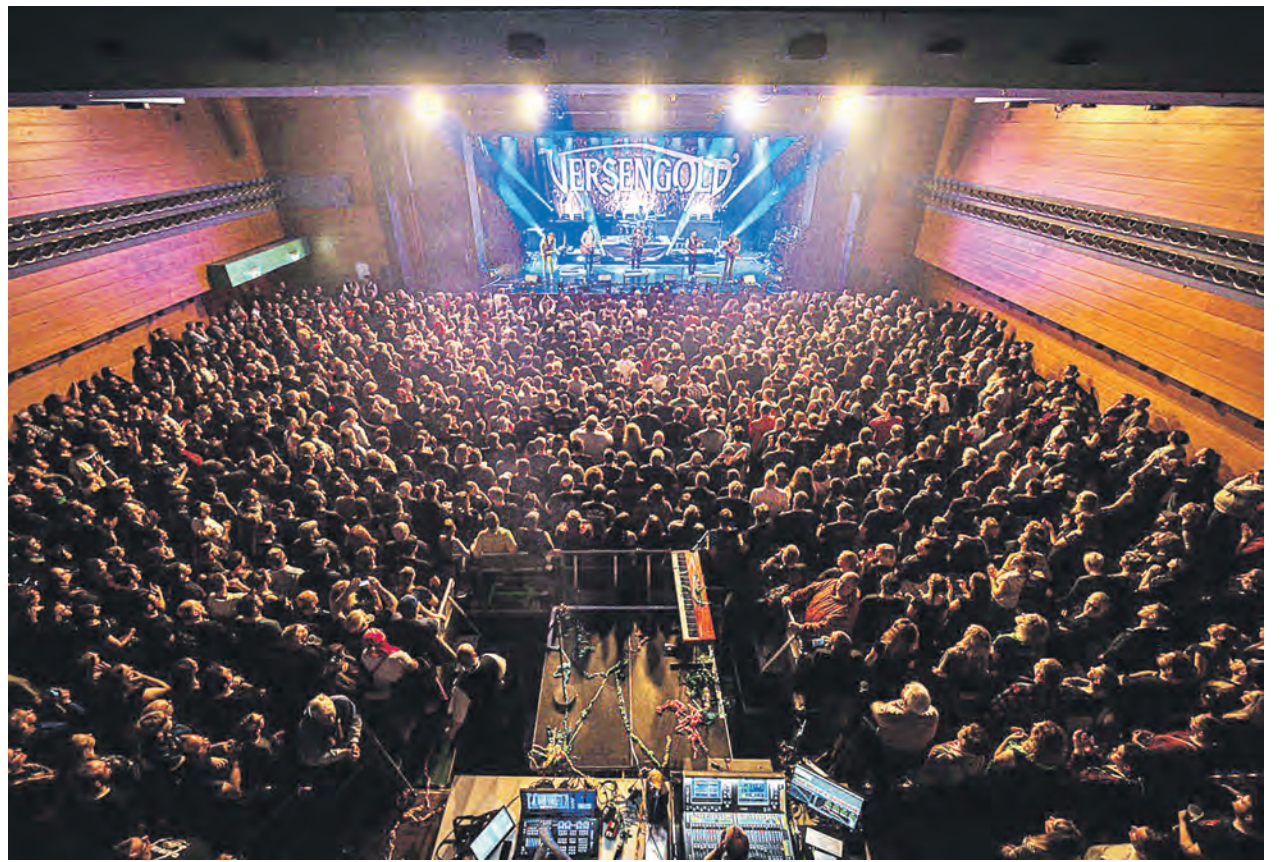
Volles Haus. Um die Sicherheit im Brandfall zu gewährleisten und eine hohe Qualität der räumlichen und technischen Ausstattung zu bieten, muss in der Europahalle einiges umgebaut und erneuert werden.

Im Zuge der Sanierung wird das Innenleben der Halle auf links gedreht: Wände sollen herausgebrochen, Heizungsrohre und Kabel umgeleitet, Rauchabzugsanlagen gebaut, neue Türen eingesetzt werden. Für die umfangreichen Maßnahmen in diesem Bereich sind insgesamt rund 2,5 Millionen Euro vorgesehen.