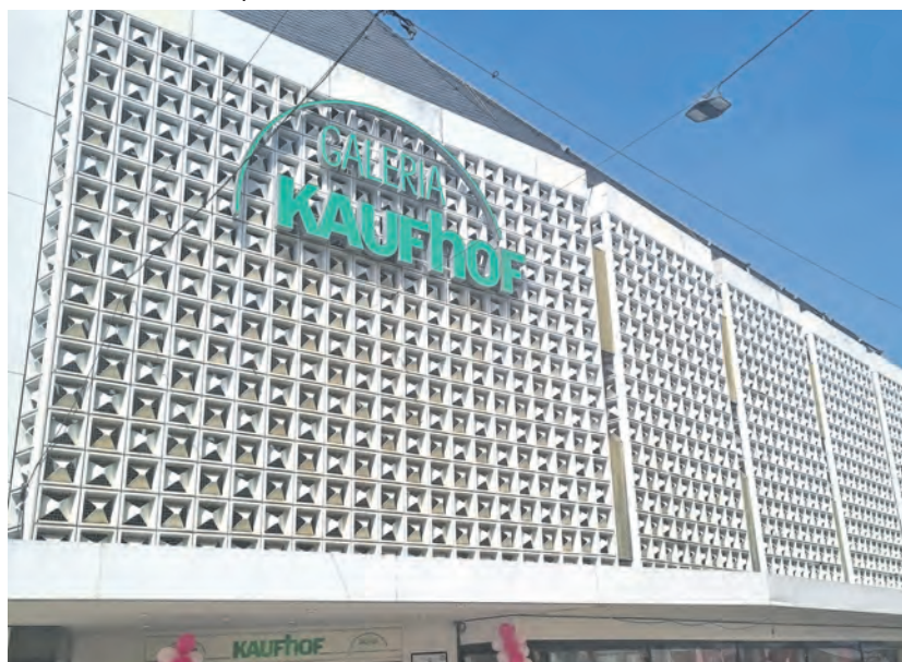
Aus nach 51 Jahren. Das Kaufhaus in der Fleischstraße gehörte beim Start zur später aufgelösten Horten-Kette und wechselte zu Kaufhof. Zu diesem Unternehmen kamen später noch die Karstadt-Warenhäuser hinzu.

Zugleich blicken der OB und der Innenstadt-Dezernent aber nach vorne: „Es ist gut für Trier, dass Galeria in der 1a-Lage Simeonstraße als Anziehungspunkt erhalten bleiben soll. Das bestärkt uns darin, weiter an der Attraktivität der Fußgängerzone und am Umfeld der Porta Nigra zu arbeiten. Handel ist Wandel – nun müssen wir in die Zukunft blicken und versuchen, die möglicherweise freiwerdenden Flächen und Gebäude in der Fleischstraße zeitgemäß weiterzuentwickeln. Wir sind optimistisch, dass das gelingen wird, denn aus vielen Hintergrund-Gesprächen und aus den jüngsten Ansiedlungen und Neueröffnungen in der Fußgängerzone wissen wir, dass die Trierer City nach wie ein hoch attraktiver Standort ist. Trier hat in den vergangenen Jahren mit Kreativität und Tatkraft schon viele große Konversionsprojekte gemeistert – das wird uns auch an dieser Stelle gelingen.“ red