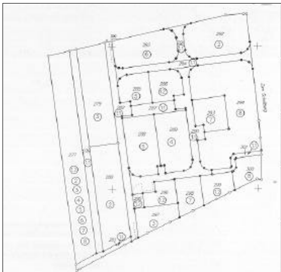
Abb.4 Umlagekarte (Neuzustand) erhalten. Die Größe des Umlagegebiets lässt u.U. nur die Bildung einer bestimmten Anzahl von Neugrundstücken zu, die entsprechend den Festsetzungen des Bebauungsplans bebaubar sind. Es ist daher nicht ausgeschlossen, dass Eigentümer, die nur ein Kleingrundstück in die Umlage eingebracht haben, kein Neugrundstück erhalten. Diese (früheren) Eigentümer können in Geld oder mit Grundstücken außerhalb des Umlagegebiets abgefunden werden.

Es kann auch sein, dass nicht alle beteiligten Grundeigentümer ein Grundstück zugeteilt