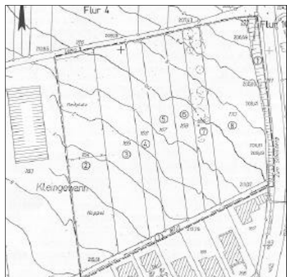
Abb.3 Bestandskarte (Altzustand) bisherige Lage

Sie dienen der Bestandsaufnahme aller Grundstücke, der Rechte an den Grundstücken und der Nutzungsart einschließlich der auf den Grundstücken ruhenden Lasten und Beschränkungen, soweit sie im Grundbuch eingetragen sind. Die Bestandskarte weist die