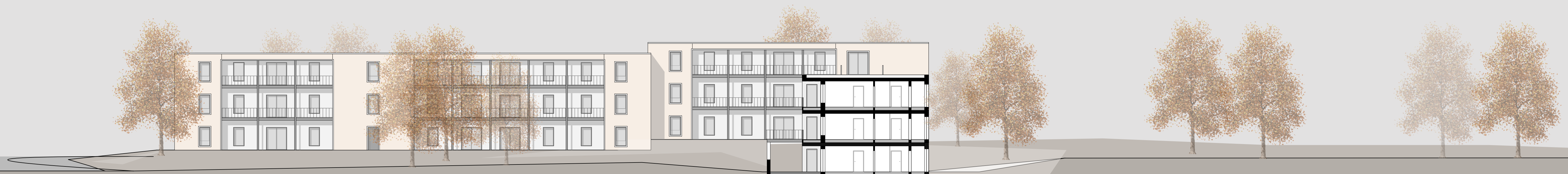
Schnitt-Ansicht Süd A-A | 1:200