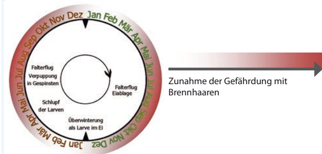
Lebenszyklus von T. processionea und Gefährdung durch Brennhaare im Jahresverlauf

Hohe Ausgangspopulationen deuten darauf hin, dass auch 2012/ 2013 mit einem verstärkten Auftreten gerechnet werden muss. In einigen Ländern werden lokale Bekämpfungsmaßnahmen vorbereitet und durchgeführt.