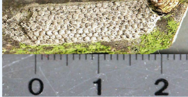
Eigelege (mit Afterschuppen getarnt)