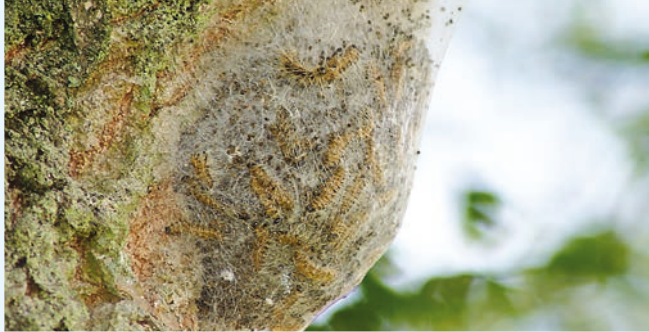
Gespinstnest am Eichenstamm