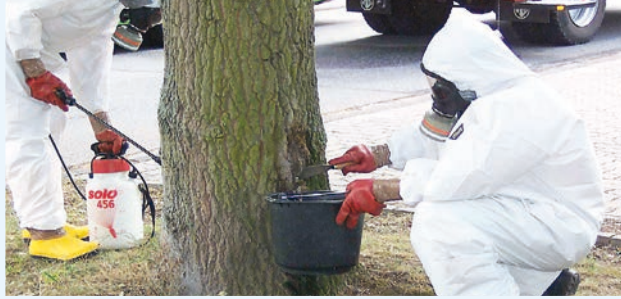
Abtragung von behandelten Gespinsten mit vollständig geschlossenen Schutzanzügen durch Spezialfirmen