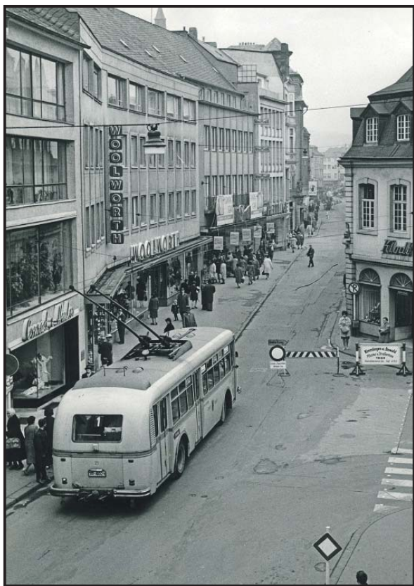
Verkehr. Ein Oberleitungsbus fährt Ende der 1960er Jahre durch die Brotstraße Richtung Bahnhof. 1970 werden die Fahrzeuge durch Omnibusse ersetzt.