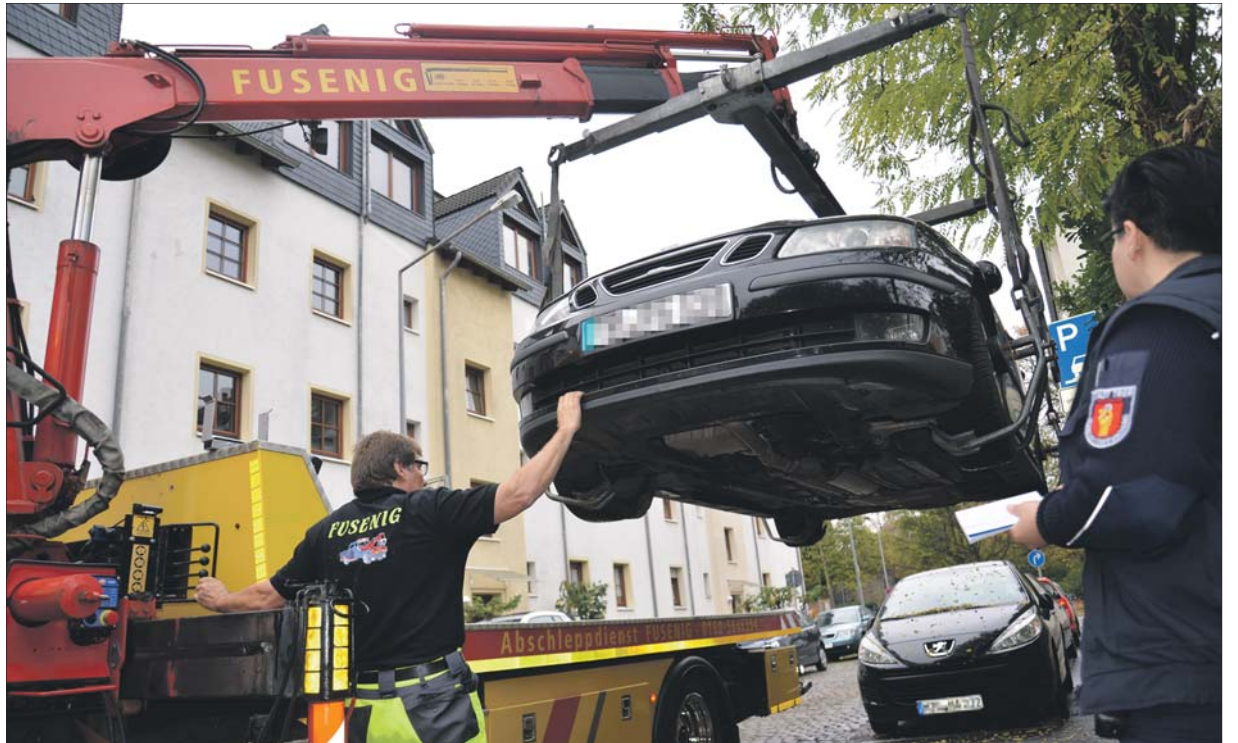
Und Tschüss. Diesen Wagen muss der Besitzer beim Abschleppunternehmen abholen. Er hatte so geparkt, dass auf dem Bürgersteig in der Schützenstraße kein Durchkommen mehr war.