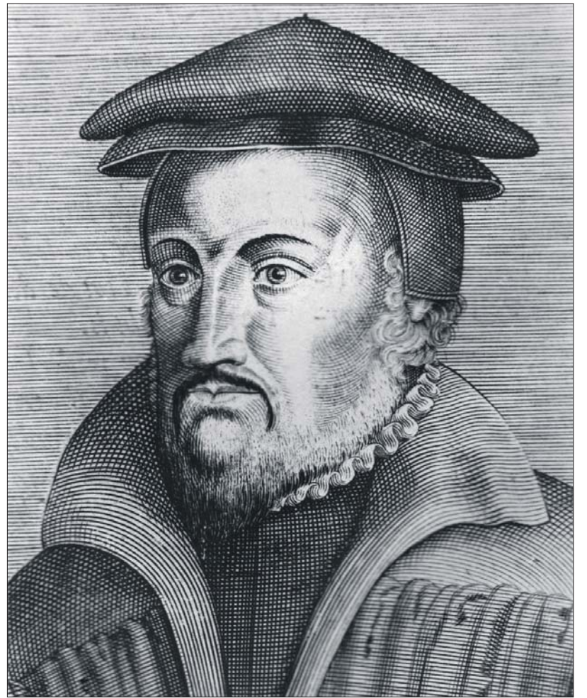
Die Geschichte der Trierer Protestanten ist reich an Konflikten: Nach dem gescheiterten Reformationsversuch 1559 der Gruppe um Caspar Olevian (Porträt von Heinrich Hondius von 1602) fanden erst im 19. Jahrhundert Trierer und Preußen, Katholiken und Protestanten allmählich zueinander. Dr. Bernd Röder präsentiert zum 500. Reformationsjubiläum am 31. Oktober, 19 Uhr, im Stadtmuseum, einen Rückblick unter dem Motto „Bis heute Ketzer?“