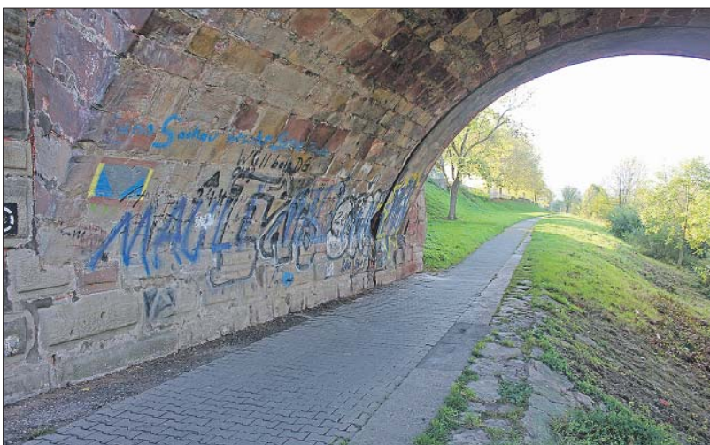
Angeschmiert. Der Weg am östlichen Moselufer unterquert die Römerbrücke. Der UBT-Antrag zielt unter anderem auf die Reinigung dieser Stelle.

Eintritt ist zukünftig kostenfrei. Die Preise für Kinderschwimmkurse bleiben konstant. Auch die Preise für den Bad-Parkplatz werden erhöht. Bis zu vier Stunden kosten für Badegäste zukünftig ein Euro statt 0,50 Cent. Die erste Stunde bleibt frei. Jede weitere Stunde kostet wie bislang 50 Cent zusätzlich. Für externe Parker, die Bad oder Saunagarten nicht besuchen, werden die Preise von 75 Cent auf zwei Euro pro 30 Minuten angehoben.