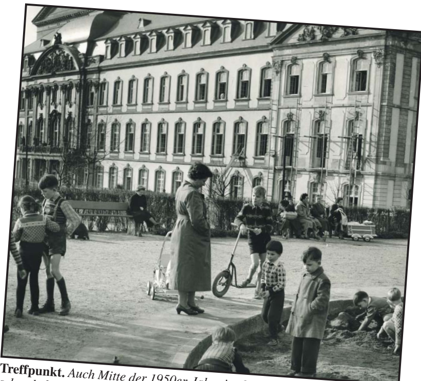
Treffpunkt. Auch Mitte der 1950er-Jahre ist der Spielplatz im Palastgarten schon beliebt bei den Kleinen, auch wenn nicht alle im Sand wühlen, sondern eher – mit Händen in den Taschen – das Geschehen beobachten.