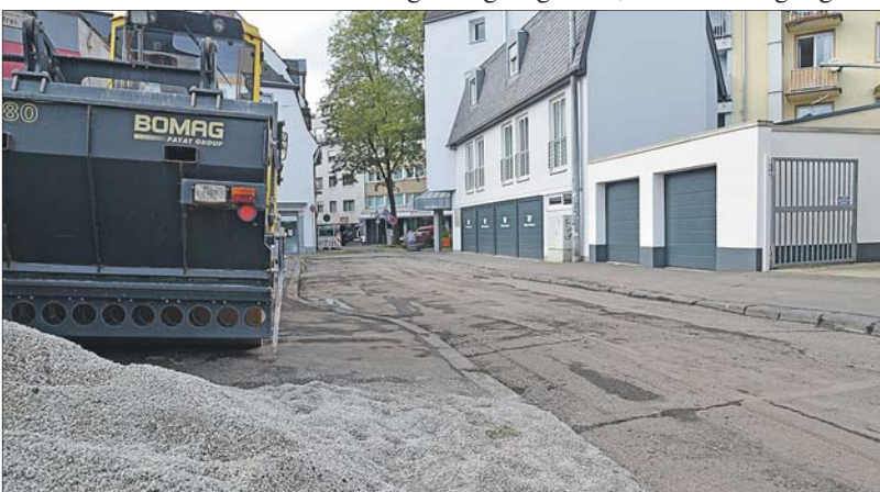
Abgefräst. Seit einigen Tagen ruht der Straßenbau in der Jüdemerstraße, die von der Antoniuskirche zur Ecke Brückenstraße (im Hintergrund) verläuft. Dieser Ort wird ab November als Platzfläche ausgebaut.

Generell werde, so führte Dezernent Schmitt weiter aus, im Bereich von Schulen und Kitas häufig kontrolliert. Neben Schulwegen werde auch auf den Zufahrtsstraßen geblitzt. Kontrollen gebe es auch in verkehrsberuhigten Straßen wie beispielsweise der Johannisstraße, auch wenn dies manchmal aufgrund der Örtlichkeiten (etwa zu kurze Strecken) schwierig sei. Dort ist Schrittgeschwindigkeit erlaubt, also maximal zehn Kilometer pro Stunde. Die Messtoleranz liegt bei acht Kilometern pro Stunde, sodass ab 19 Kilometern pro Stunde ein Verstoß vorliegt.