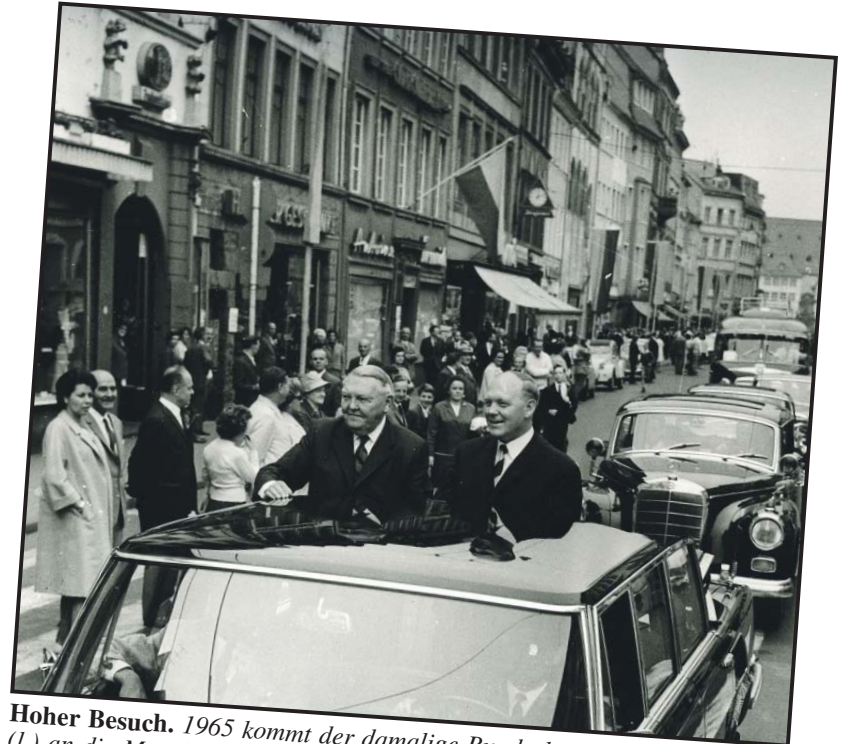
Hoher Besuch. 1965 kommt der damalige Bundeskanzler Ludwig Erhard (l.) an die Mosel und fährt mit dem rheinland-pfälzischen Staatsminister Heinrich Holkenbrink durch die Simeonstraße.