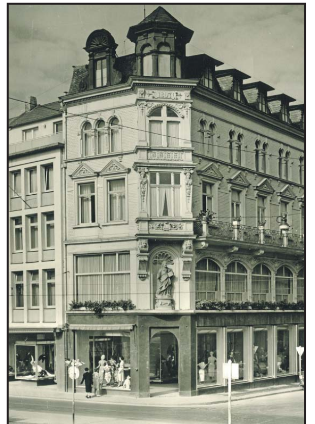
Einkaufen. Frauen kleiden sich Anfang der 1960er Jahre im „Haus der Dame“ an der Ecke Brot-/Johann-Philipp-Straße ein. Heute befindet sich im Erdgeschoss eine Bäckerei.

i Öffnungszeiten: Montag bis Freitag 9 bis 17, Samstag und Sonntag 10 bis 17 Uhr. Dauer: Voraussichtlich bis Jahresende. Reproduktionen einzelner Fotos für private Zwecke sind möglich. Auskünfte hierzu bei Anita Schömer unter 0651/718-4422.