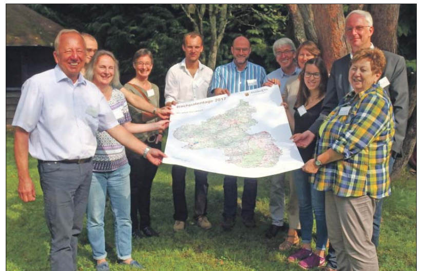
Wasserfreunde. OB Wolfram Leibe mit Bachpaten beim Auftakt der Veranstaltungsreihe am Naturfreundehaus Trier-Quint.

Das Aktionsprogramm des Ministeriums für Umwelt, Energie, Ernährung und Forsten Rheinland-Pfalz fördert seit 1995 erfolgreich die Wiederherstellung naturnaher Gewässer. Das Ministerium und das Landesamt für Umwelt laden 2017 zu der Veranstaltungreihe „Bachpatentage“ an sechs verschiedenen Gewässern in Rheinland-Pfalz ein.