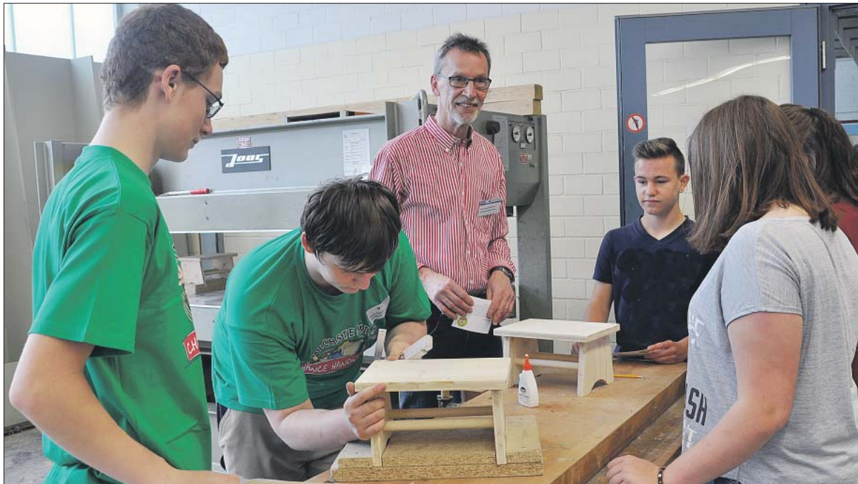
Nachwuchswerbung. Durch diverse Veranstaltungen versucht beispielsweise die Handwerkskammer, Schüler für ihre Berufe zu interessieren. Gut ausgebildete Fachkräfte haben sehr gute Chancen auf dem Arbeitsmarkt.

Besonders erfreut ist er über den Trend bei Arbeitslosen zwischen 15 und 25 Jahren: „Hier haben wir fast elf Prozent weniger als noch im August 2016. Ausbildungsabsolventen sind als Fachkräfte gefragt und haben gute Chancen, eine Stelle zu finden.“ Insgesamt 3378 Menschen mussten sich im August neu oder erneut ar-