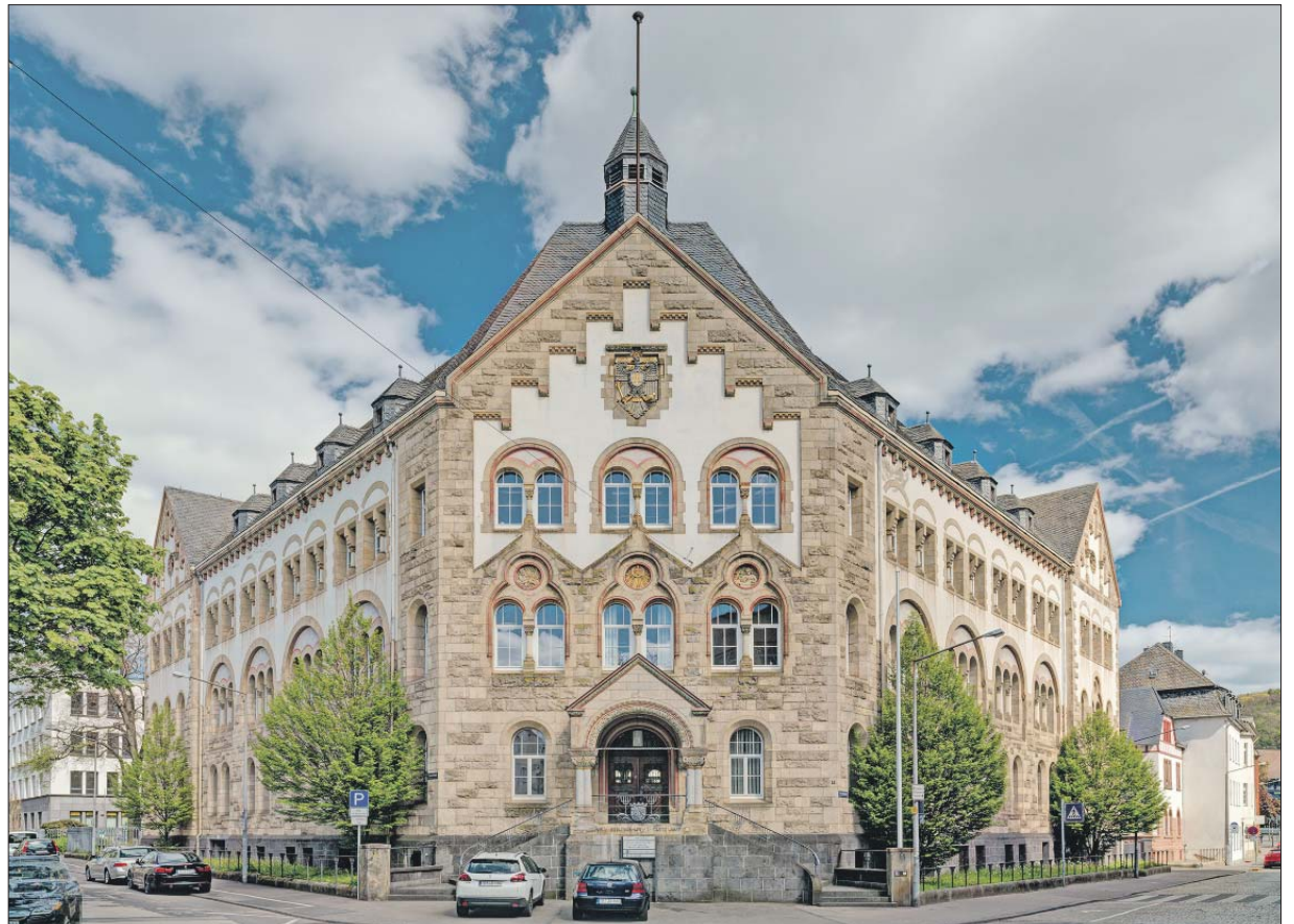
Neuromanischer Stil. Das ehemalige Vermessungs- und Katasteramt in der Sichelstraße steht – neben vielen anderen Bauten – am Tag des offenen Denkmals für Führungen offen.

Die ehemalige Klosterkirche war der erste hochbarocke Sakralbau Triers (1714-17). Die bauzeitliche Ausstattung ist nahezu vollständig erhalten, etwa die Empore mit Kölner Stuckdecke und die Orgel von 1757. Imposant ist auch der Hochaltar mit bewegtem Architekturrahmen und Hauptbild von Ludwig Counet von 1721.