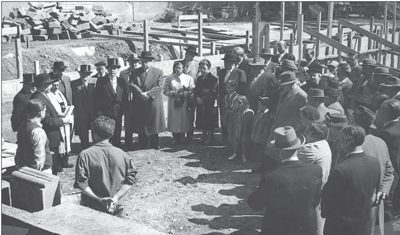
Neue Ära. Feierliche Grundsteinlegung für den Neubau der Synagoge an der Ecke Kaiser- und Hindenburgstraße am 26. August 1956. Als Grundstein diente ein Überrest aus den Trümmern der alten Synagoge.