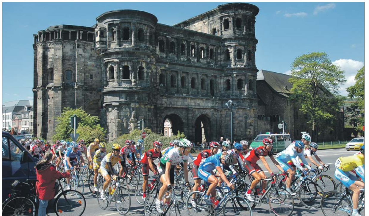
Radfahrstadt Trier. So wie 2005 bei der Rheinland-Pfalz-Rundfahrt könnte mit der Deutschland-Tour wieder ein professionelles Radrennen im August 2018 in Trier Station machen.

Trier bewirbt sich als Etappenort für Radsport-Event 2018 / Rekordergebnis beim Stadtradeln